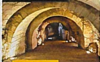
LA FORTERESSE SOUTERRAINE.