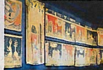
LA GALERIE DE L'APOCALYPSE.